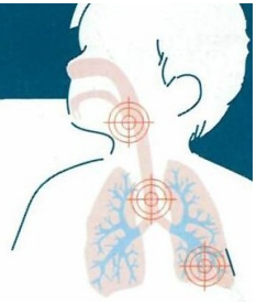
Positionnement des corps étrangers dans les voies respiratoires

La fausse route peut être fatale. L'assistante maternelle doit bien connaître les gestes de premiers secours.