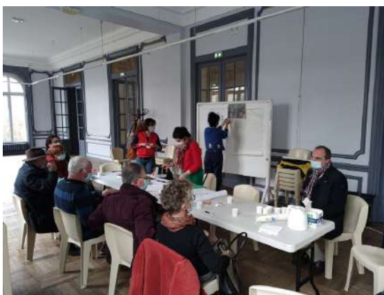
Étude sur le Château Dalle-Dumont