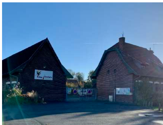
Le tiers lieux de la ferme odoux