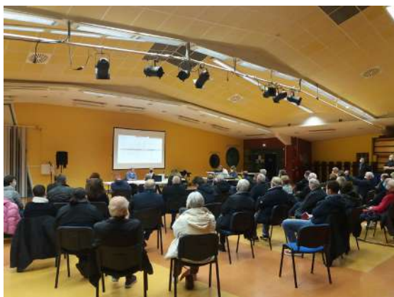
Ensemble Construisons Wervicq-Sud