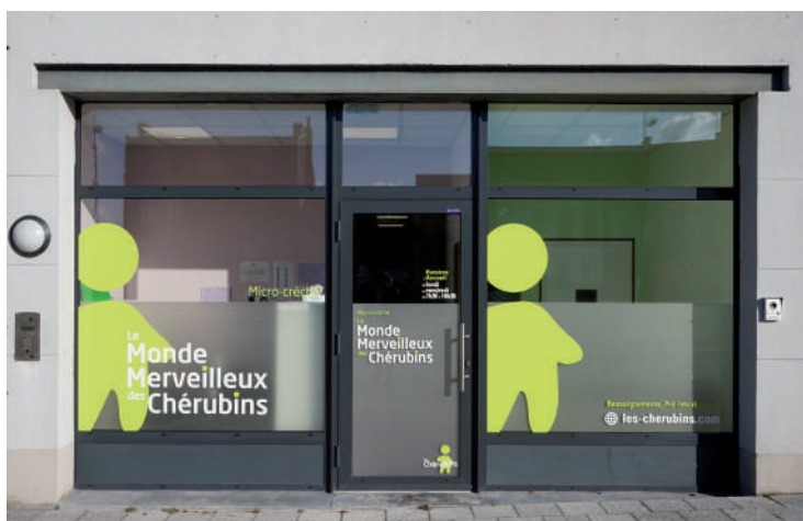
Le Monde Merveilleux des Chérubins (Actuellement en activité) Place de l'Europe