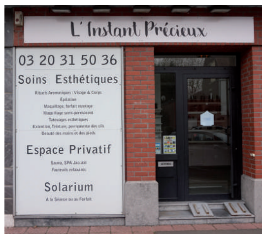
L'Instant Précieux (Reprise de l'institut Beleza) (Actuellement en activité) Rue Gabriel Péri