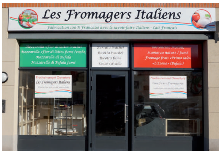
Les Fromagers Italiens (ouverture prochaine) Place de l'Europe