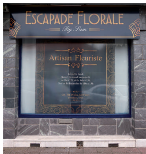
Escapade Florale By Sam (ouverture le 6 décembre) Rue Gabriel Péri